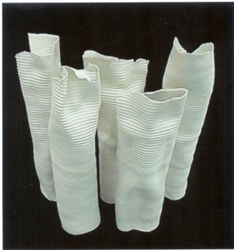
„Gruppe“ - Porzellan - 1280°C - ca. 50-70 cm